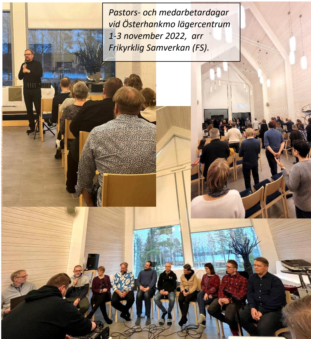
Pastors- och medarbetardagar vid Österhankmo lägercentrum 1-3 november 2022, arr Frikyrklig Samverkan (FS).